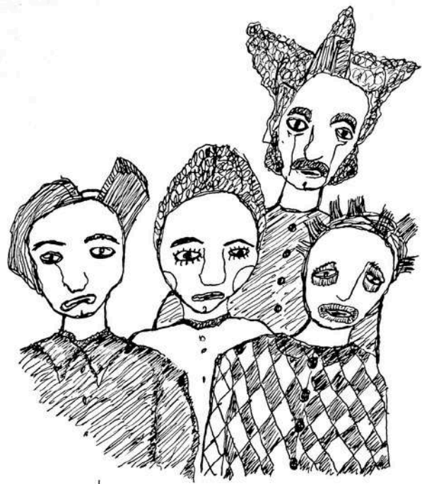
les Masques de l'ébaurdi

MASQUES EN TISSUS LÉLIE LÉANDRE ANSELME MASCARILLE