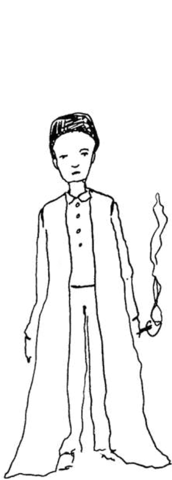
LE JEUNE MOLIÈRE