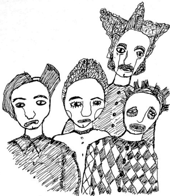
les Masques de l'ébaurdi

MASQUES EN TISSUS LELIE LEANDRE ANSELME MAJORELLE